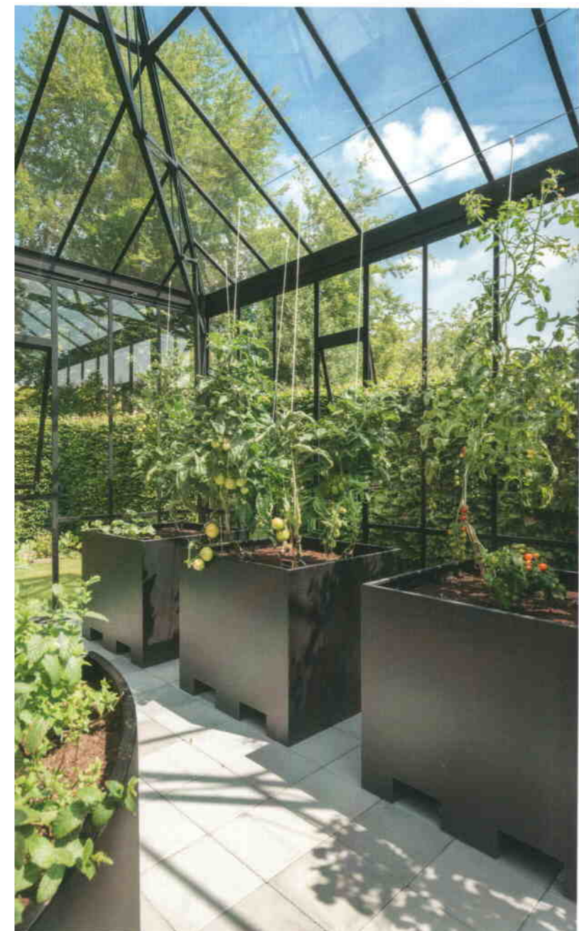
Claude Strubbe, © De Nieuwe Smid

De Silirub Tradition combineert het uitzicht van klassieke stopverf met mechanische eigenschappen van moderne voegkitten.