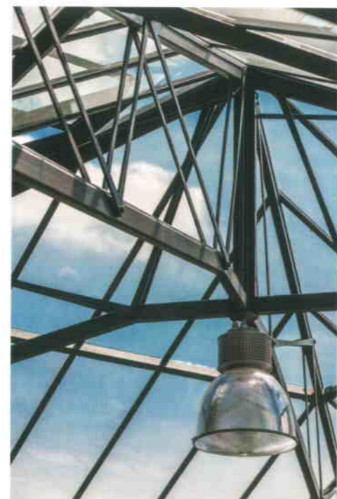
Claude Strubbe, © De Nieuwe Smid

Met een gewone standaardvoegkit zou het handwerk van het gesmede metaal niet tot zijn recht komen. Met de Silirub Tradition is dat wel het geval.