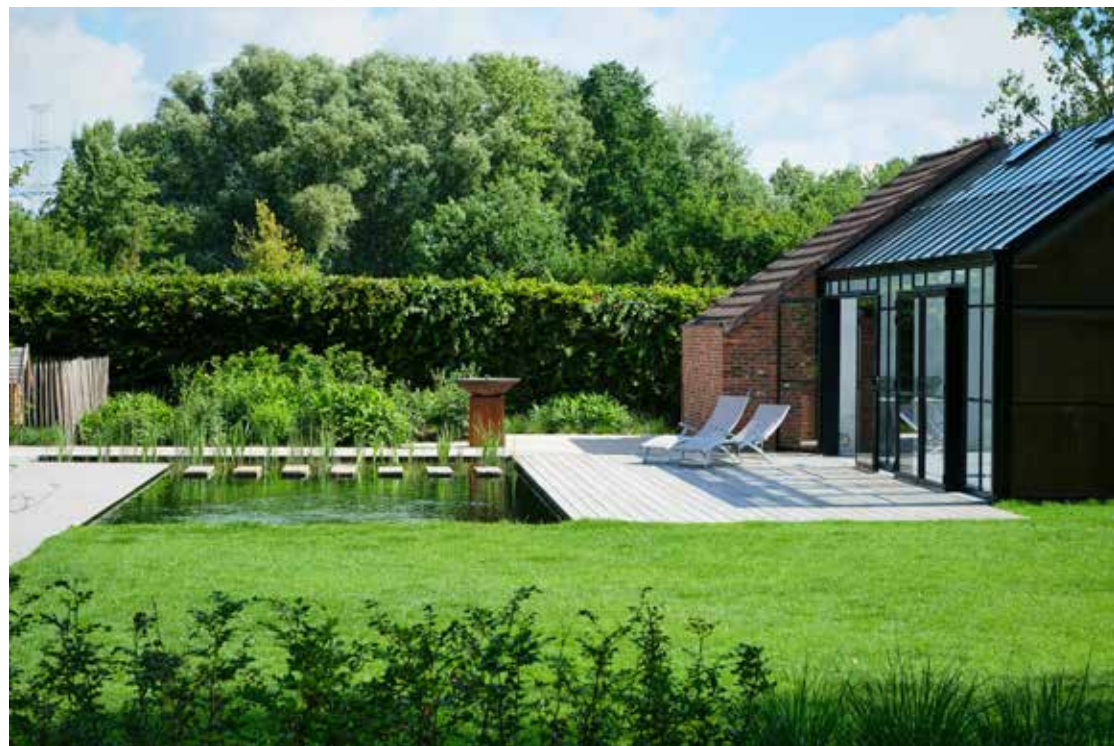
De Nieuwe Smid legt bij dit project het accent op de grote dubbele deuren die volledig open kunnen. Ze geven het bijgebouw nog meer karakter en trekken de pracht van de tuin nog meer naar binnen. De kleine raampjes bovenaan zorgen op hun beurt voor de juiste luchtcirculatie en ook zonnedoeken kunnen geïntegreerd worden. Hierdoor blijft het tijdens de zomermaanden lekker fris binnenin.